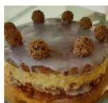
Iris, Haselnuss-Torte, 20cm