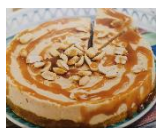
Mia, Cheesecake Salzkaramell, 18-20cm

Für 6 Personen 18cm \emptyset / für 6-8 Personen 20cm \emptyset