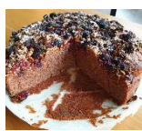
Rosi, Marroni mit Granola + Himbi, 24 cm